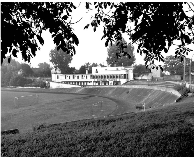
Bonn, Poststadion Bonn (mit Radrennbahn)