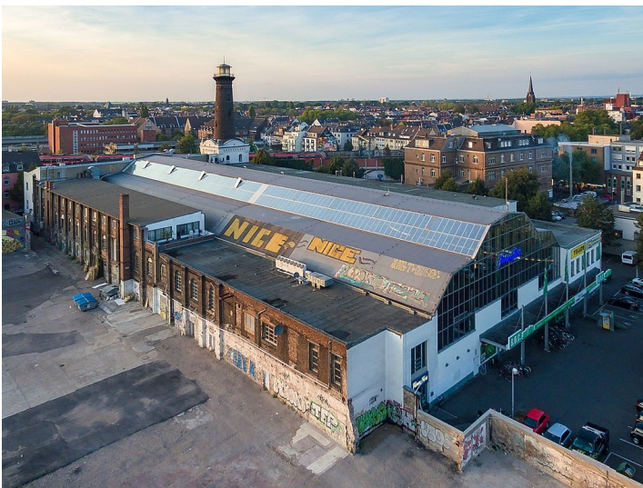
Das Gelände der früheren Helios-Elektrizitäts AG in Köln-Ehrenfeld mit der Rheinlandhalle im Vordergrund und dem Helios-Leuchtturm dahinter (2016).