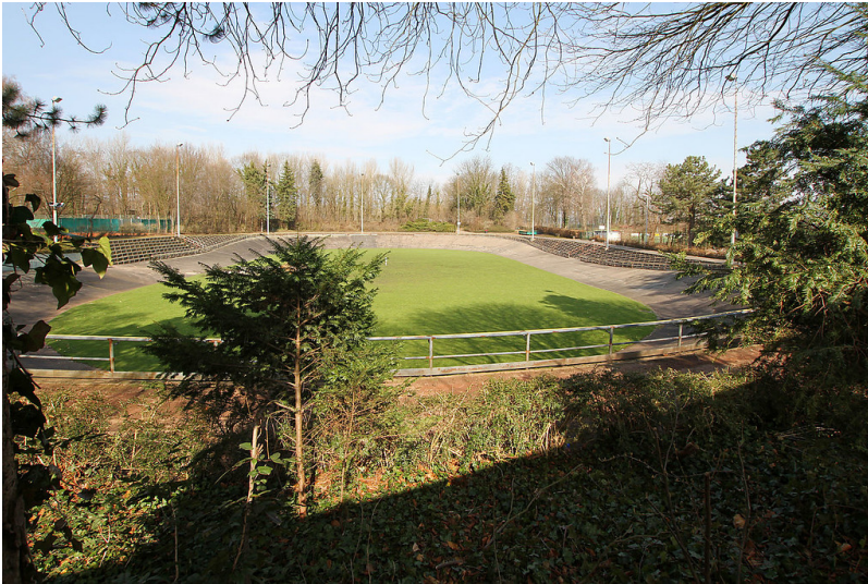
Blick auf die stillgelegte frühere Radrennbahn Hürth (2013).