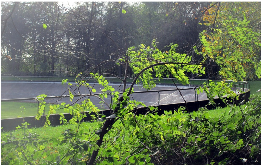
Blick auf die östliche Steilkurve der Radrennbahn Dorperhof bei Solingen-Burg/Höhscheid (2019).