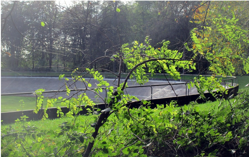
Blick auf die östliche Steilkurve der Radrennbahn Dorperhof bei Solingen-Burg/Höhscheid (2019).