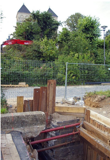
Bei Bauarbeiten 2015 aufgetauchter und zufällig entdeckter Teil der Stützmauer der "Kunibertsrampe", des Wasserflughafens auf dem Rhein auf der Höhe des Stifts Sankt Kunibert (im Bildhintergrund).