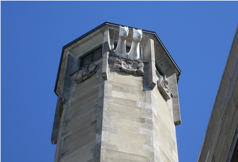
Der Richmodisturm in der Richmodstraße in Köln-Altstadt-Nord (2019), Teilansicht.