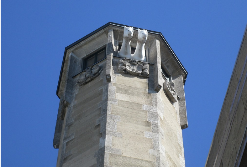
Der Richmodisturm in der Richmodstraße in Köln-Altstadt-Nord (2019), Teilansicht.