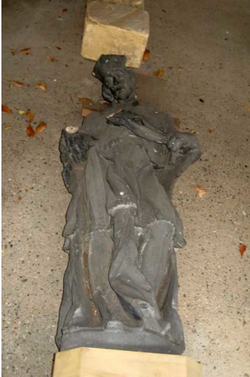
Heiligennische und Standbild Johannes Nepomuk in Landau (2015)