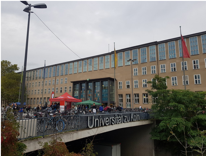
Hauptgebäude Vorderseite/Albertus-Magnus-Platz (2019)