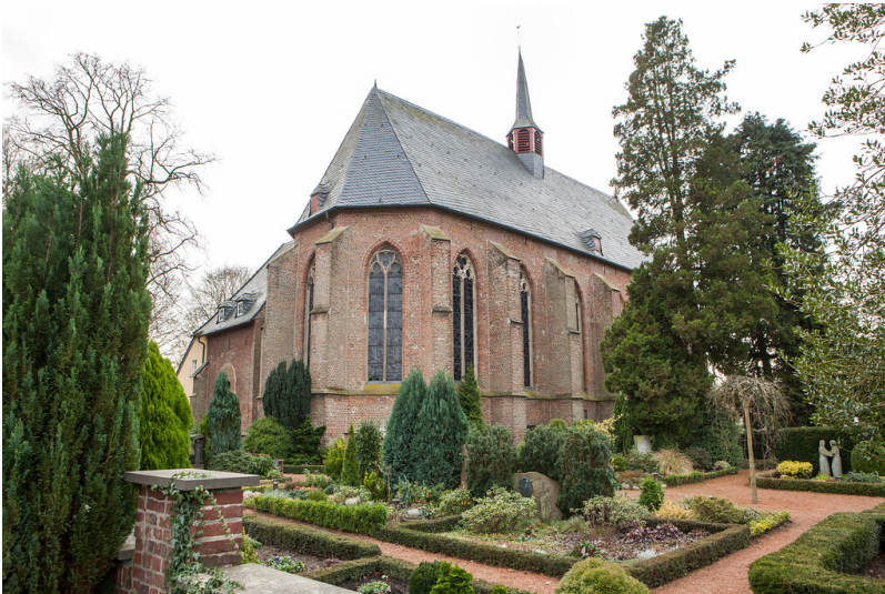
Klosterkirche St. Mariae Himmelfahrt in Hamminkeln-Marienthal (2015)