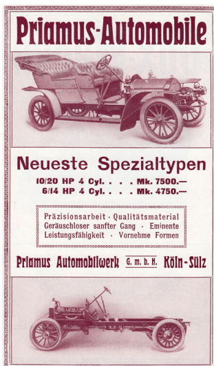
Werbeanzeige "Priamus-Automobile - Neueste Spezialtypen" der Köln-Sülz Priamus Automobilwerk G.m.b.H. in Braunbeck's Sport-Lexikon von 1910.