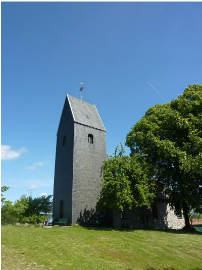
Windrather Kapelle (2019)