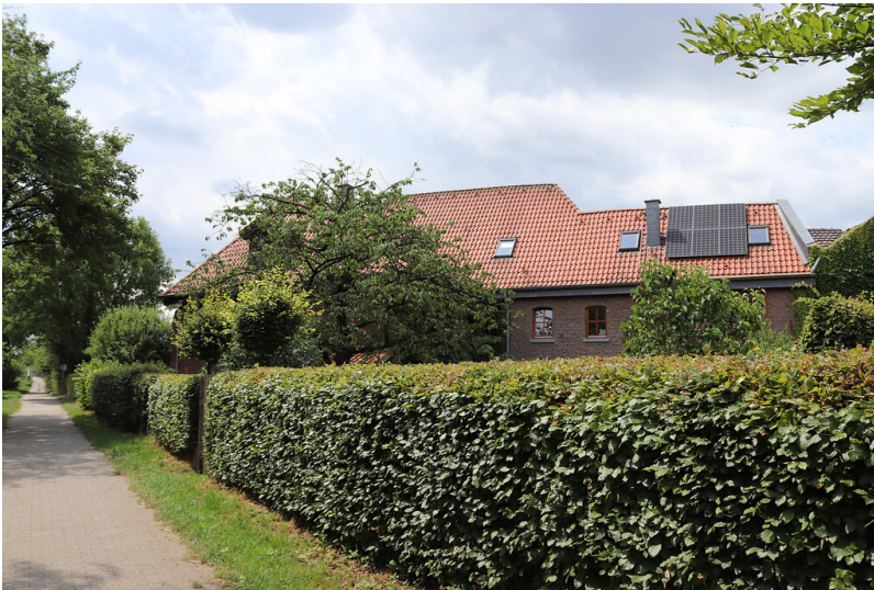
Früheres Mühlengebäude der Mühle Zweibrüggen (2022)