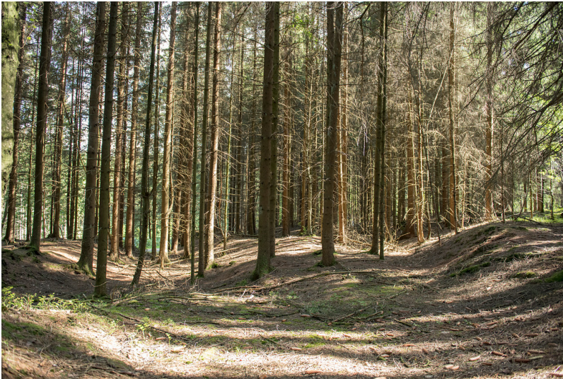
Hohlwege der Brüderstraße in Marienberghausen (2019)