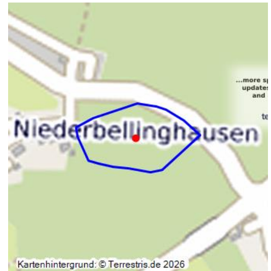
Nach Ausgrabungsbefunden rekonstruierter Grundriss der Burg Bellinghausen in Niederbellinghausen bei Wiehl

Östlich des Ortes Niederbellinghausen liegen in einem Waldstück die Überreste einer Burg, bei welcher es sich sehr wahrscheinlich um die Stammburg des Rittergeschlechtes derer von Bellinghausen handelt.