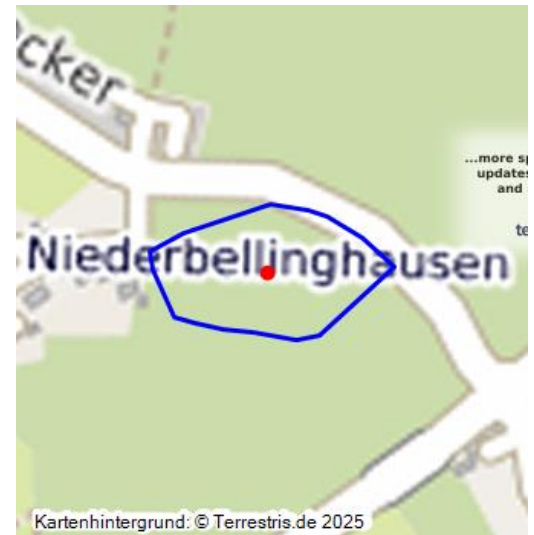
Nach Ausgrabungsbefunden rekonstruierter Grundriss der Burg Bellinghausen in Niederbellinghausen bei Wiehl

Östlich des Ortes Niederbellinghausen liegen in einem Waldstück die Überreste einer Burg, bei welcher es sich sehr wahrscheinlich um die Stammburg des Rittergeschlechtes derer von Bellinghausen handelt.