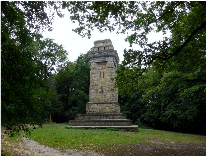
Bismarckturm Hoher Busch in Viersen (2019)