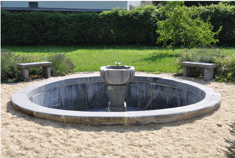
Marmorspringbrunnen im Pfarrgarten in Villmar (2019)