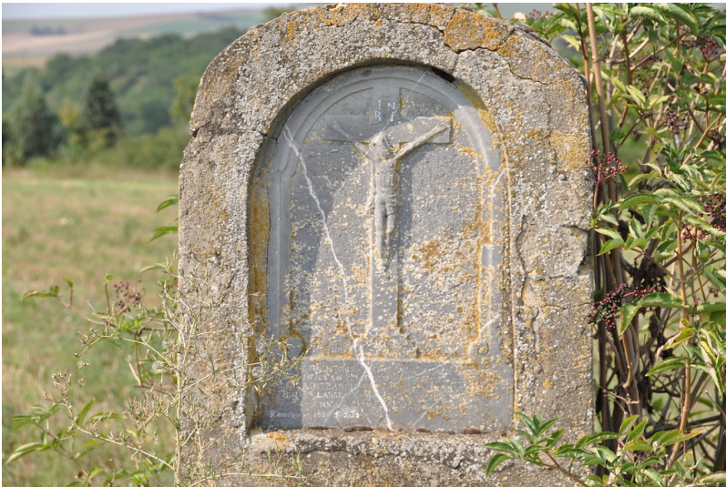
Der Bildstock am Wegrand in Villmar zeigt Jesus am Kreuz (2019).