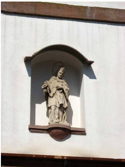
Standbilder Johannes Nepomuk in Gossersweiler (2019)