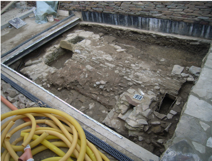
Zisterne im Burghof Kronenburg (2019)