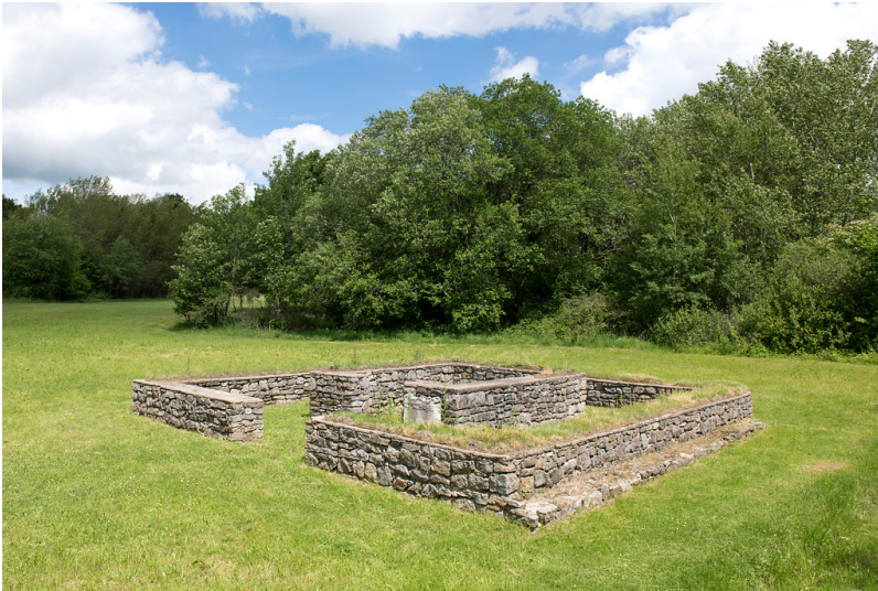
Matronenheiligtum in Zingsheim (2019)