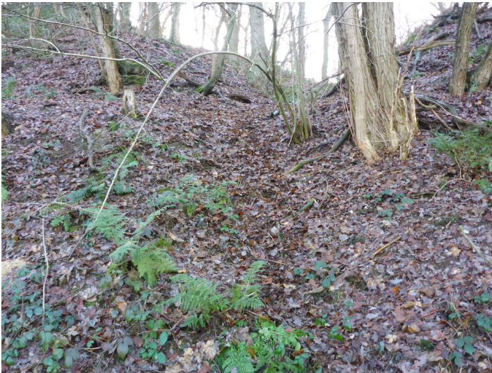
Quellort nahe des Hofes "Großer Born" (2020)