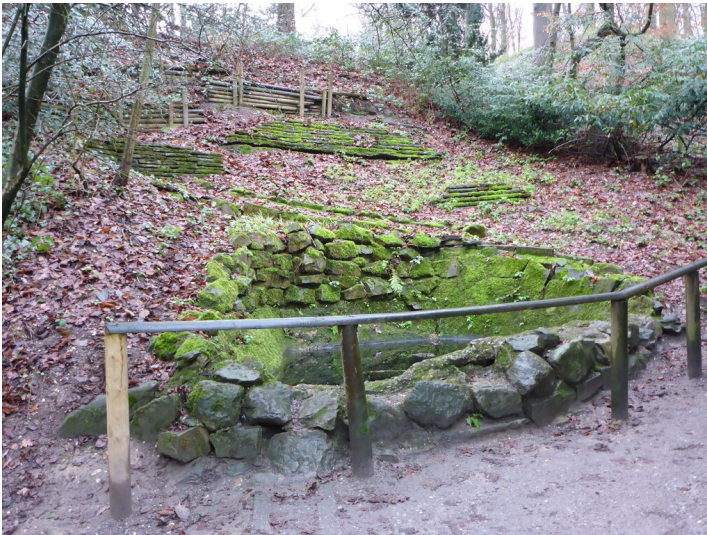
Quelle am Museum auf dem Oermter Berg (2021)