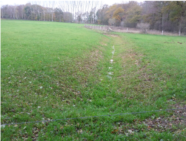
Vernässte Stelle neben Quellbereich (2020)