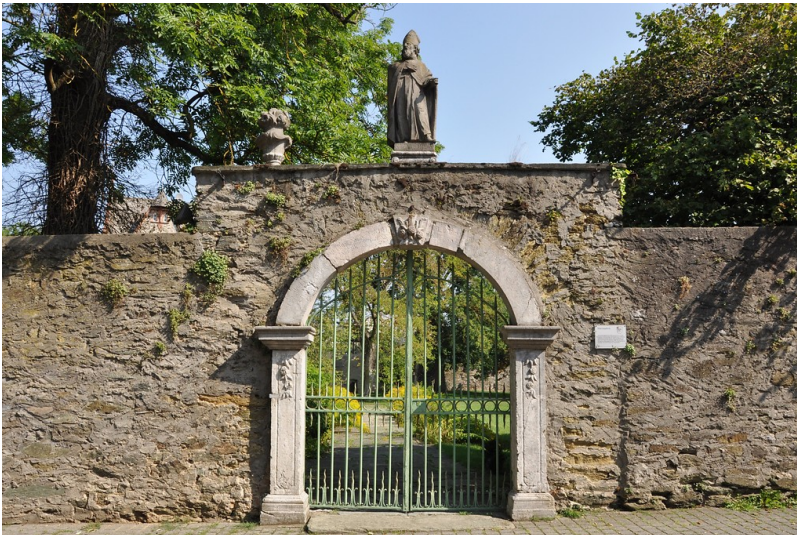
Valeriuspforte vor dem Pfarrgarten in Villmar (2019)