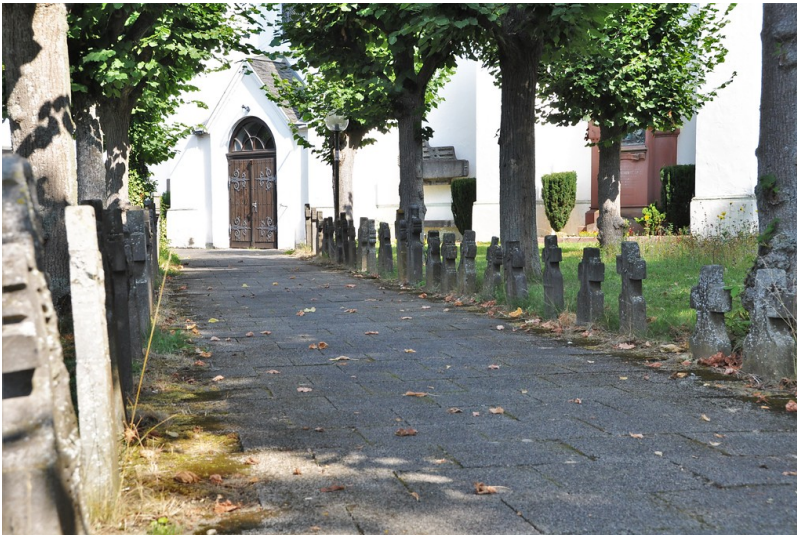
Alter Kirchhof der Pfarrkirche St. Peter und Paul in Villmar (2019)