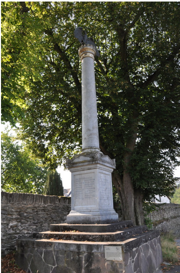
Kriegerdenkmal für Erinnerung an den Deutsch-Französischen Krieg 1870/71 in Villmar (2019)