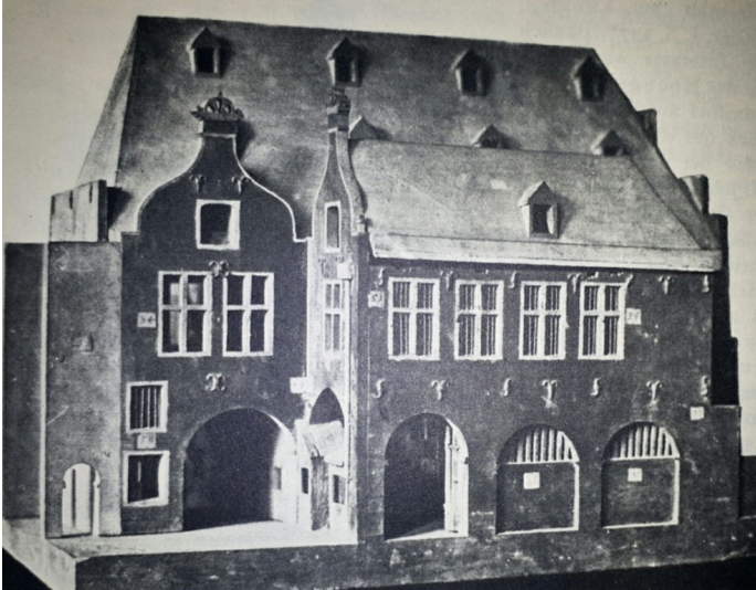
Holzmodell von 1726 der Kölner "Bingerhäuser und Hacht mit Hachtpforte, Nordseite".