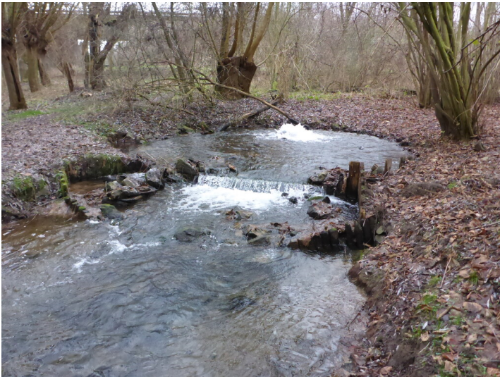
Quelle im Finkenberger Bruch (2020)