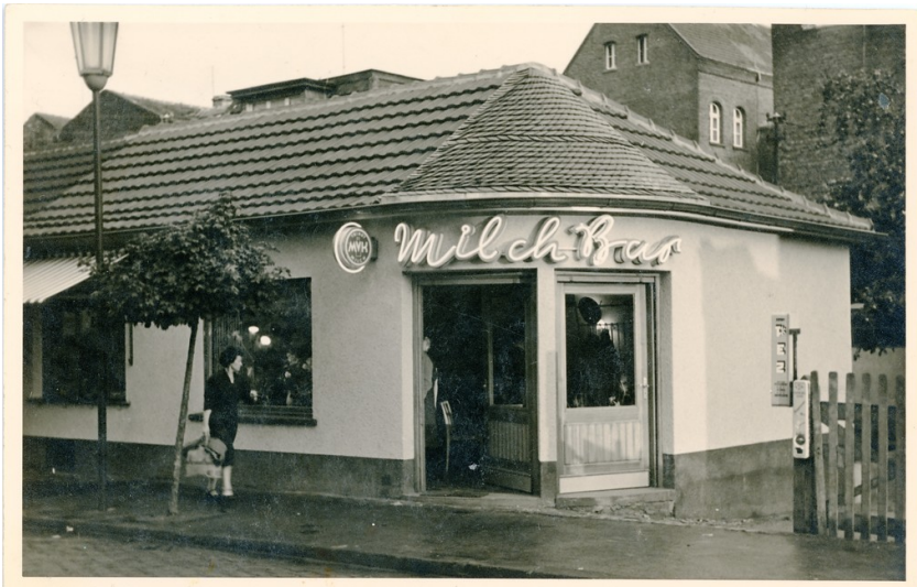
Die Milchbar Brühl auf einer historischen Aufnahme aus den 1950er-Jahren.