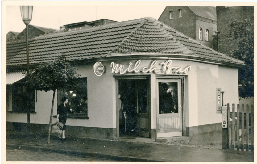
Die Milchbar Brühl auf einer historischen Aufnahme aus den 1950er-Jahren.