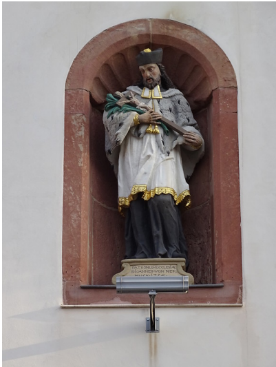
Standbild Johannes Nepomuk in Edenkoben (2019)