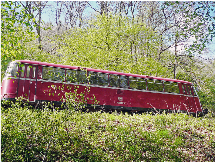
Schienenbus der Kasbachtalbahn (2017)