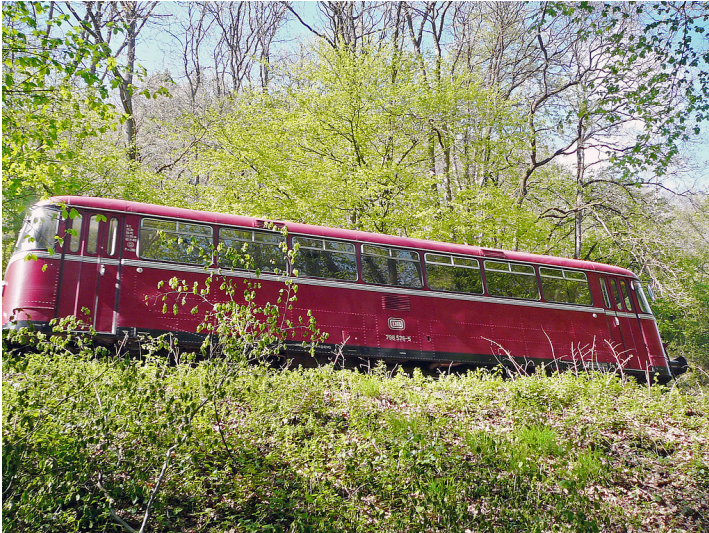
Schienenbus der Kasbachtalbahn (2017)