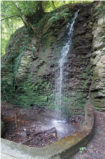
Kaskade bei Bruchhausen (2019)