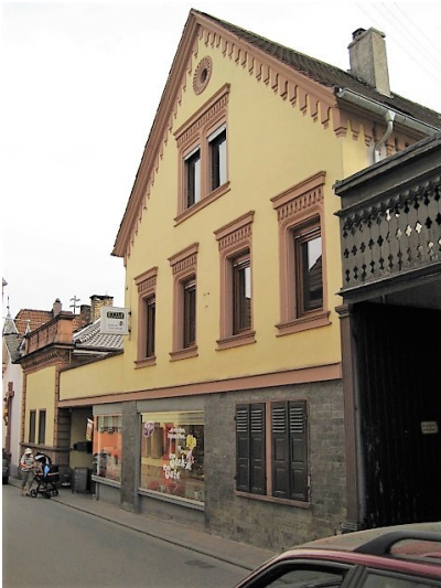
Wohnhaus des Leonhard Ullrich, mit integriertem Ladengeschäft in der Hartmannstraße 5 in Maikammer (2014)