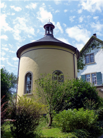
Privatkapelle des Gutshauses der Hofanlage "Haanhof" in Unkel (2017)