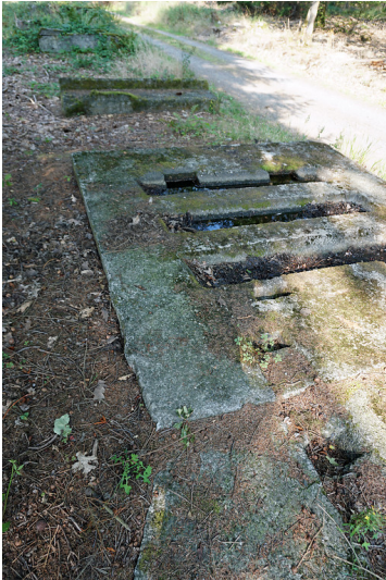
Reste der V1-Feuerstellung Nr. 328 am Asberg (2019)