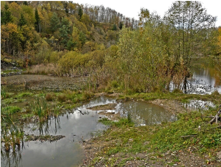
Steinbruch am Asberg im Westerwald (2013)

Bundesland: Nordrhein-Westfalen, Rheinland-Pfalz