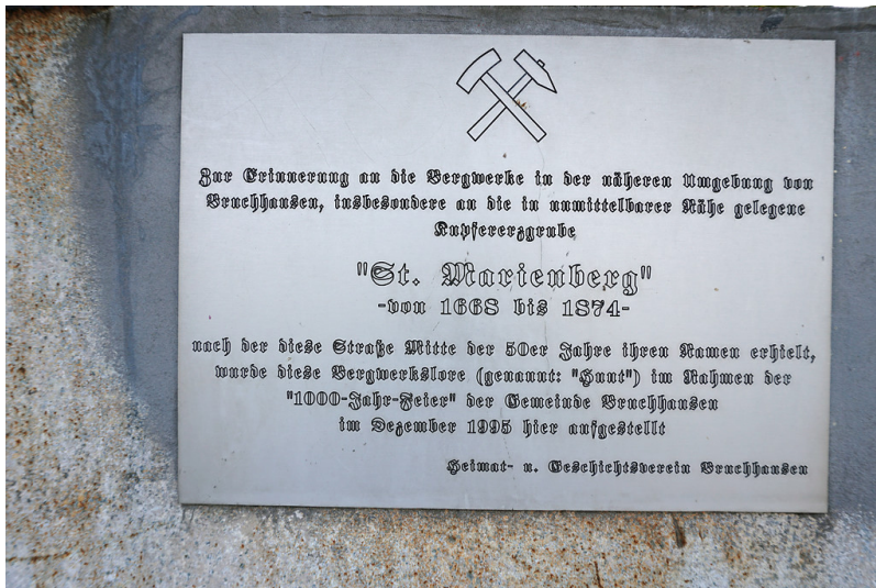
Bergwerkslore in Bruchhausen (2019)