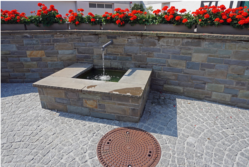
Brunnenplatz in Bruchhausen (2019)