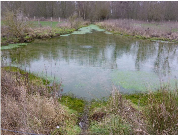
Einleitungsquelle am Finkenger Bruch (2019)