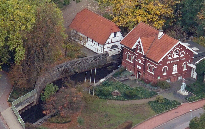
Mühle Pau in Dinslaken-Hiesfeld (2020)