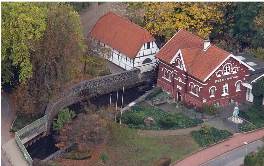
Mühle Pau in Dinslaken-Hiesfeld (2020)