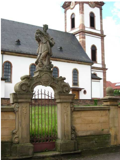
Standbild Johannes Nepomuk in Edesheim (2013)