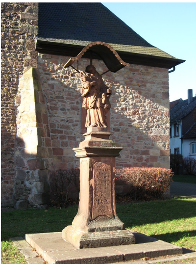
Standbild Johannes Nepomuk Kirrweiler (2019)