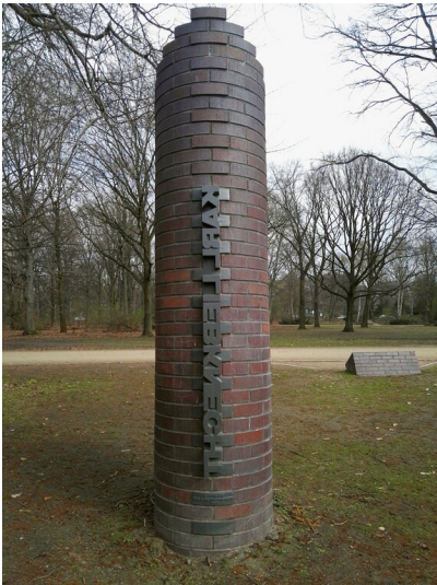
Mahnmal für Karl Liebkecht (2019)