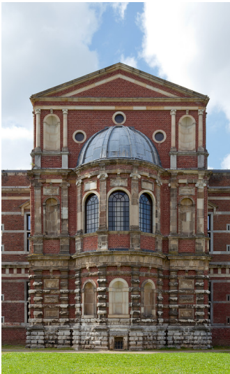
Jülich, Zitadelle mit ehem. Residenzschloss, Düsseldorfer Str.