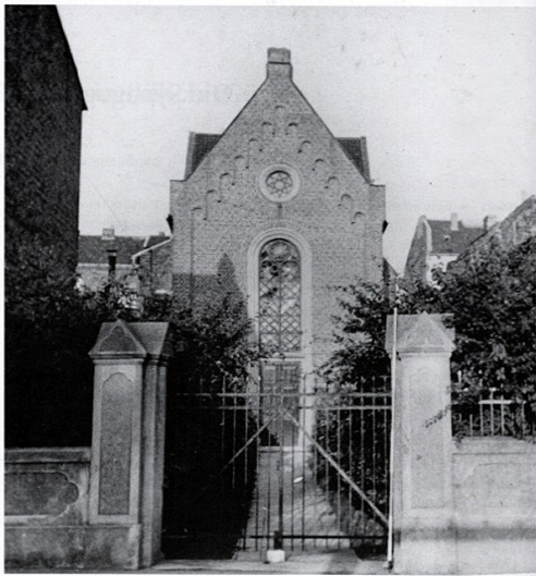
Historische Aufnahme der 1862 eingeweihten Synagoge in Jülich aus dem Jahr ihrer Zerstörung 1938.