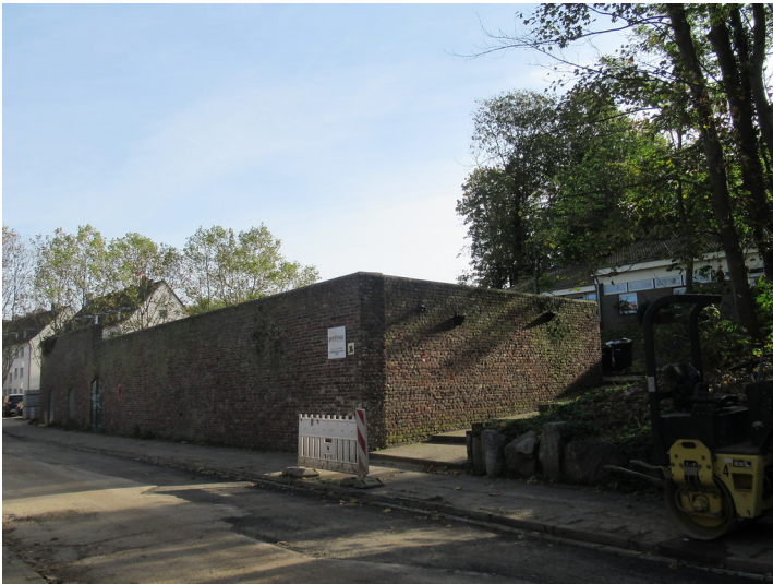
Jülich, Bastion St. Jakob, Am Aachener Tor